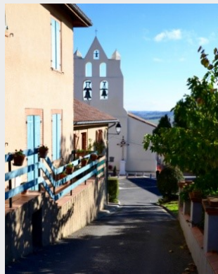
Eglise Saint-Amat de Sauveterre.