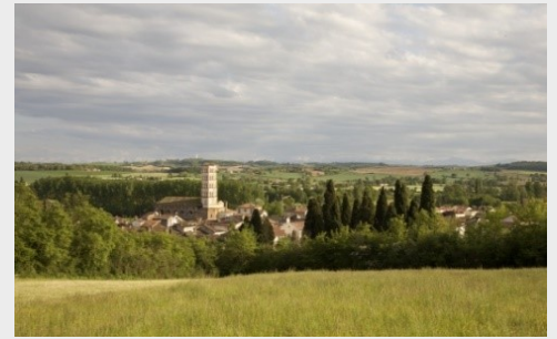
Lombez, vue depuis Saint Majan