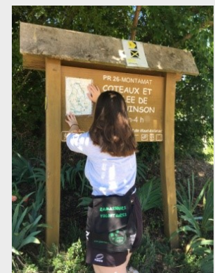
Départ randonnée PR 26 de Montamat