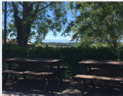
Tables de pique-nique avec vue sur les Pyrénées

Office de Tourisme du Savès 3 Rue du Chanoine Dieuzaide 32130 Samatan Tél : + 33 (0)5 62 62 55 40 contact@tourisme-saves.com www.tourisme-saves.com