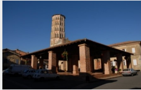
Lombez centre historique, cathédrale Sainte Marie