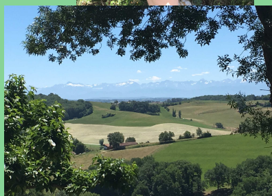
Vue des Pyrénées depuis Montamat