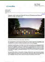
Le Brouilh-Monbert : Gagnez votre week-end dans le Gers au "Domaine au Périsson" dans Ça colle aux Basques