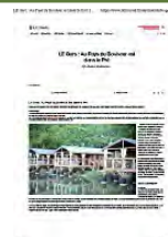
Le Gers : Au Pays du Bonheur est dans le Pré "Infotravel.fr" le 5 juin 2021

Connu pour ses élevages d'oies et de canards, ses bastides bien préservées, son Armagnac et son doux relief, le Gers regorge d'adresses intimistes à découvrir sans plus attendre.