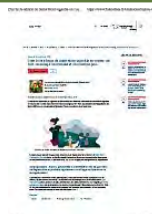
C'est la 3ème édition de Saint-Mont vignoble en course : On boit, on mange, on s'amuse et on cours un peu...