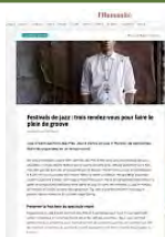
Festival Jazz in Marciac "Humanite.fr" le 4 juin 2021

Jazz à Saint-Germain-des-Prés, Jazz à Vienne et Jazz in Marciac, de captivantes festivités organisées en un temps record.