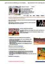
Le monde taurin à la relance : Vic-Fezensac, toujours très toros