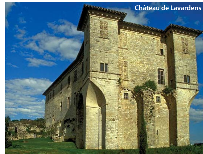
Château de Lavardens

Auch, Jégun, Valence-sur-Baïse, Larressingle, Condom, La Romieu, Lectoure, Miradoux, Saint-Clar et Fleurance