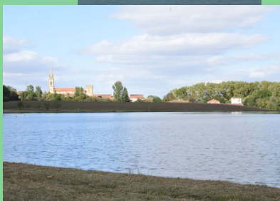
Base de Loisirs à Saramon