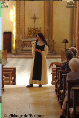
Abbaye de Boulaur